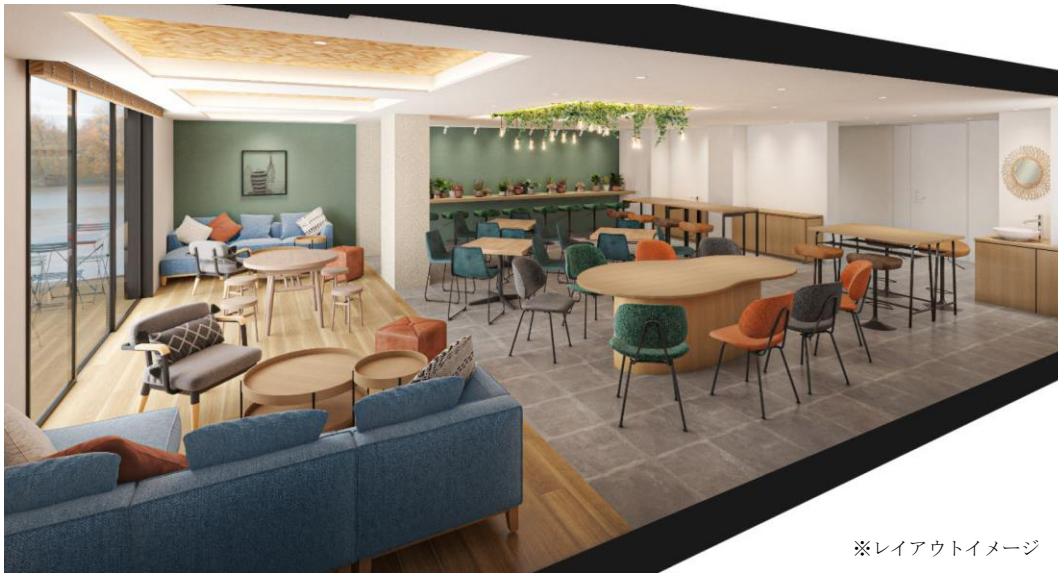
※レイアウトイメージ

女子学生専用レジデンスならではのオシャレで暖かみのあるカフェラウンジ。Wi-Fi環境を整備。複数人で利用しやすいソファ席やテーブル席の他に、お一人でも利用しやすいカウンター席も設けており、シーンに合わせたご利用が可能です。屋外でも食事できるように、カフェバルコニー席も設置。