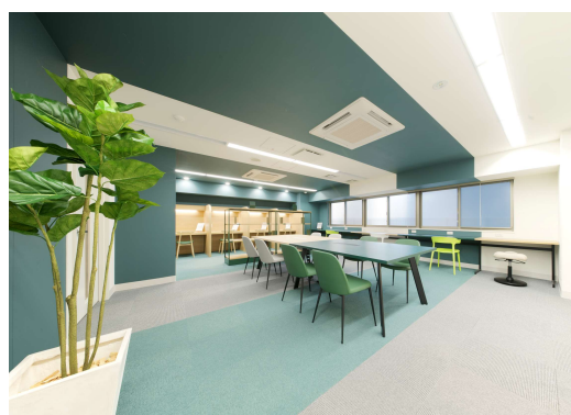
3階スタディールーム