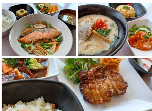
朝食・夕食の食事イメージ

初めてひとり暮らしをする学生やその保護者にも、安心して利用できる食環境を提供します。