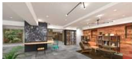
フリーワークスペース