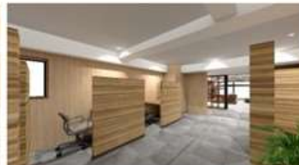
スタディスペース