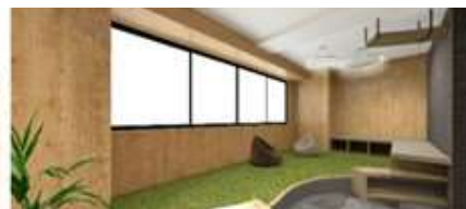
リラクックスペース