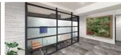
ミーティングスペース