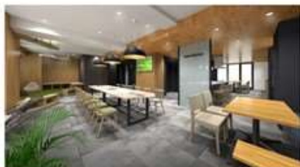
オープンラウンジ

「ひとり暮らしはしてみたいが、寂しいのも嫌だ。」という学生が住みたくなるマンションをめざしました。出会いや発見、経験を多く生み出せるように、ひとりで満喫する部屋はもちろん、学生が交流できる機会を充実させ、「学生時代と、その先の未来もともに活躍できる仲間との出会いの創出」をコンセプトに込めました。