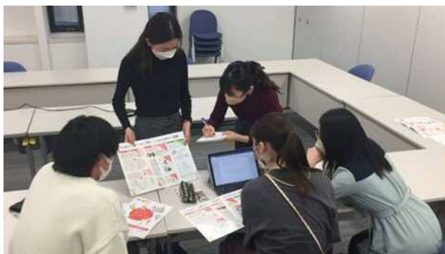
ナジックラボのコンテンツとして「入居前懇親会」を企画するコミュニティマネージャーたち

会社設立以来2018年まで26年間、会社あげて全国7か所で学生と教育機関やマンションオーナー、協力企業など3000名以上を動員して開催してありました「ナジックウェルカムパーティー」は、今後は学生にフォーカスし、新入居学生だけではなく、全入居学生を対象としたパーティーとしてリニューアルし、5月に開催します。その他、社会人基礎力に注目したコンテンツや異文化交流に触れるイベントなどをコミュニティマネージャーと一緒に企画運営を行っていきます。