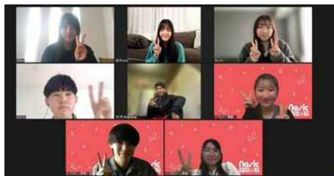
コミュニティマネージャー運営の「入居前懇親会」に、地元からオンラインで参加する高校3年生たち