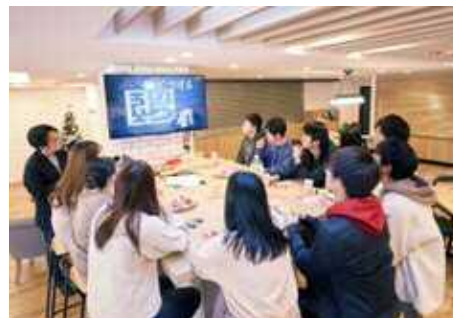
大学1年生対象「初めてキャリアを考える」ワークショップ

アルバイト情報の提供や就職セミナーの実施に加え、「ナジックラボ」と連携しながら、ナジックOB・OGによる就職や留学の体験談セミナーを実施していきます。また、これらを東急不動産ホールディングスグループのリソースを生かし、ナジックでしか学ぶことのできないオリジナルのキャリアプログラムを提供します。