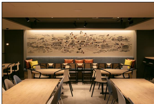
共同制作したアートウォール