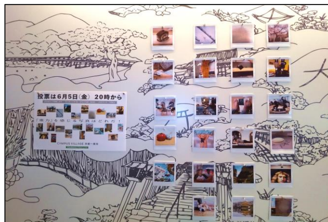
ワークショップ後の展示作品