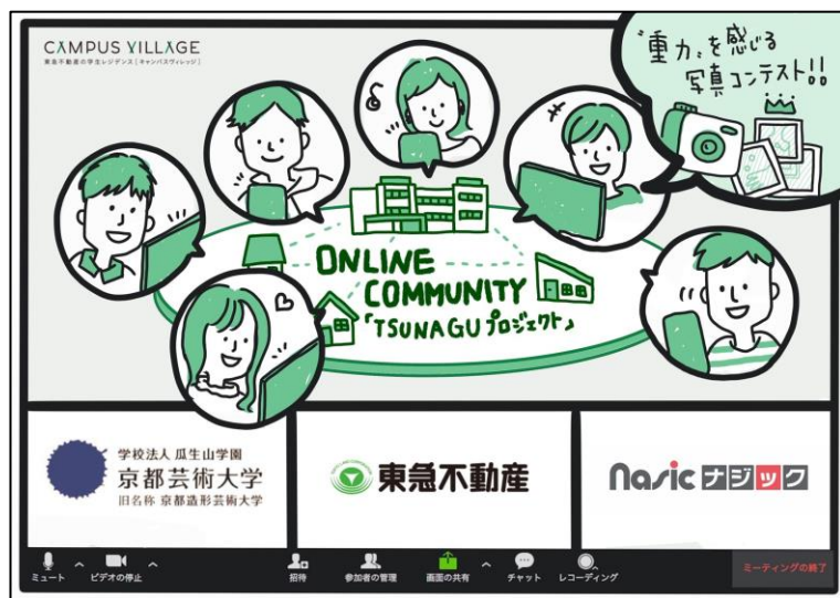
オンラインワークショップ概念図

今後も様々なイベントを行うキャンパスヴィレッジの特徴を活かして、入居する学生だけでなく、保護者の方にも安心していただける住まいを目指し、更なる開発を進めて参ります。