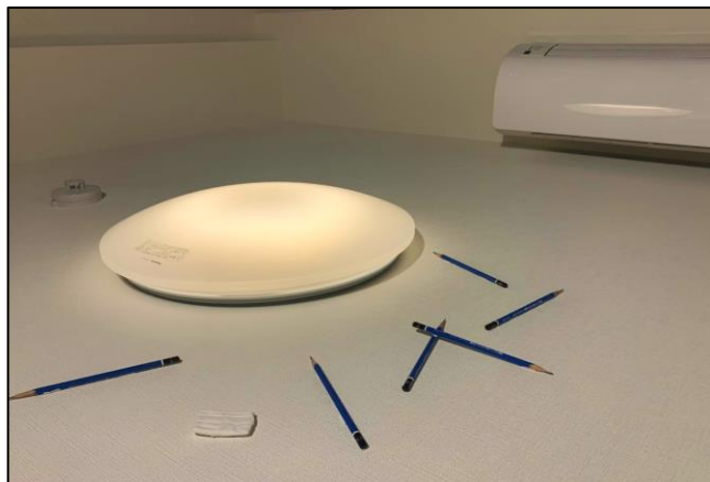
「重力を感じる写真コンテスト」受賞作品