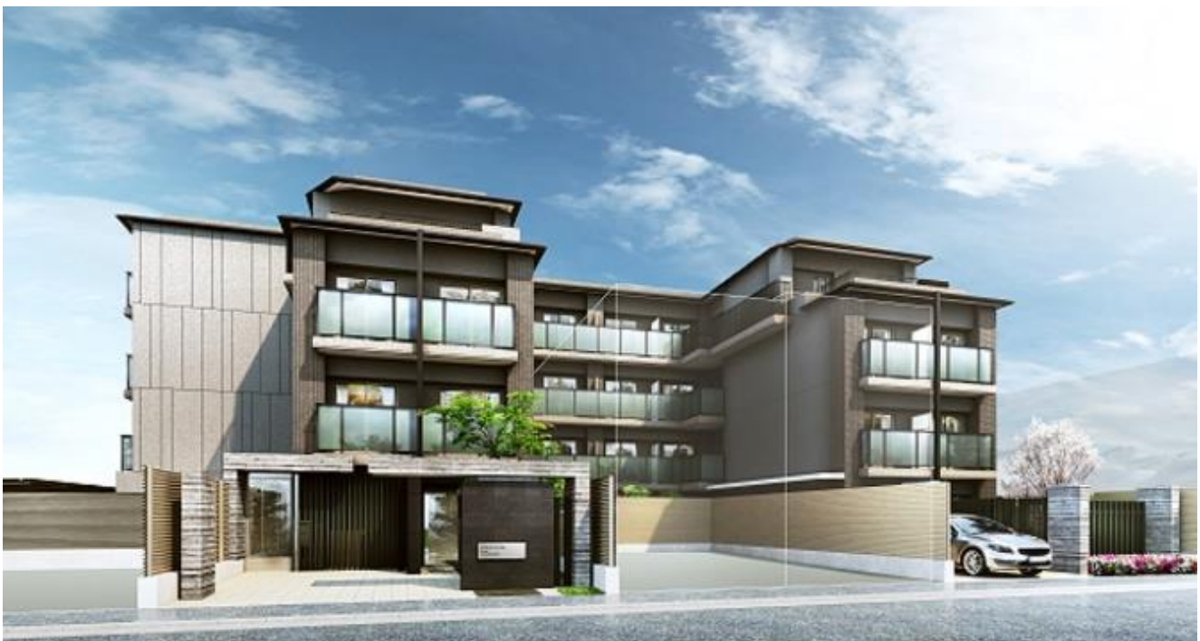
キャンパスヴィレッジ京都一乗寺（外観）