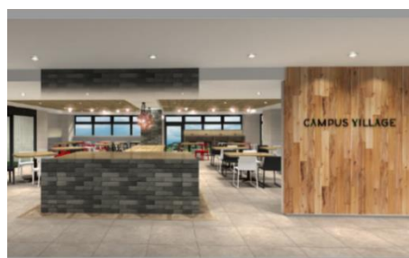
キャンパスヴィレッジ京都伏見（カフェテリア）