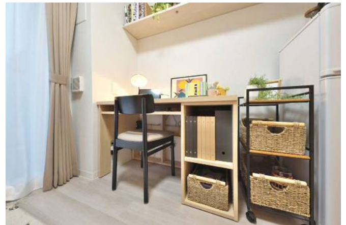
専有部（アクタスオリジナルデスク）