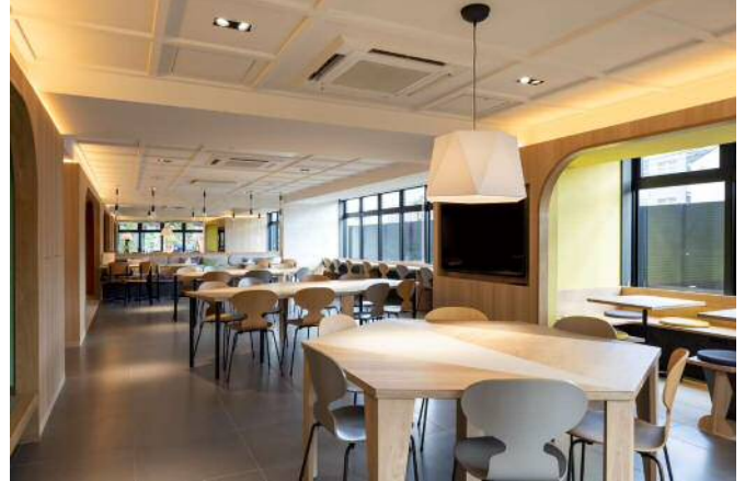
1階共用部（カフェテリア）