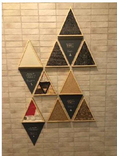
マテリアルパネル

2022年に竣工した「キャンパスヴィレッジ大阪近大前」においても、1階の共用部に入居者が日々の生活の中で循環型経済「サーキュラーエコノミー」を身近に感じ、学ぶことができるような空間作りを行うなど、学生レジデンス「CAMPUS VILLAGE (キャンパスヴィレッジ)」シリーズでは、入居学生が環境取り組みを学ぶきっかけになるような仕掛けを積極的に提供しております。