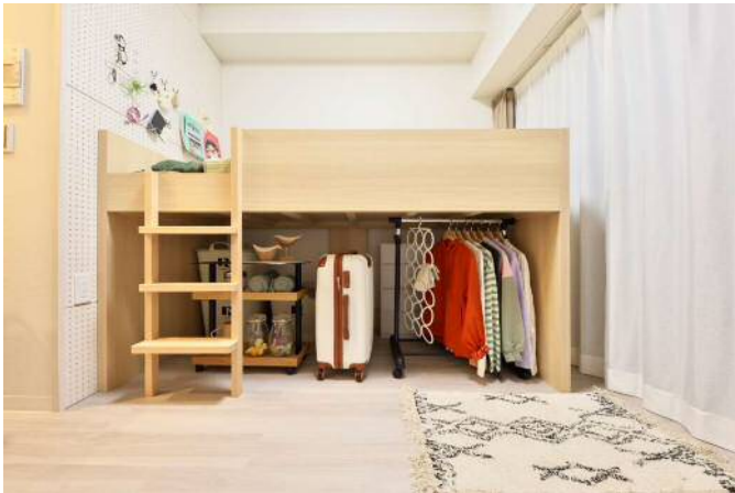
専有部（アクタスオリジナルストレージベッド）