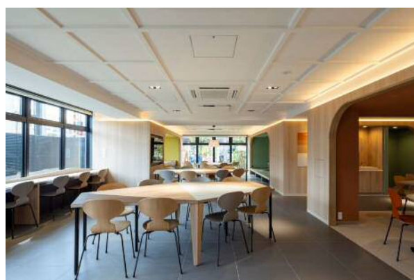
1階共用部（カフェテリア）