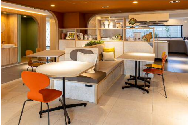
1階共用部（カフェテリア）

学生が実際に使用し、環境配慮を重視した家具の開発とその後のリペア、リユース、リサイクルの具体例を学ぶことができる場面を提供することで、SDGs をより身近に体感できる取り組みとなりました。