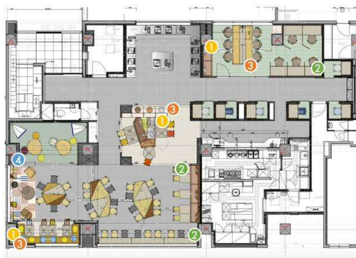
マテリアルキャプションプロット図