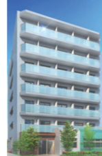
リビオセゾン早稲田

JR中央・総武線「高円寺」駅 徒歩11分 鉄筋コンクリート造 地下1F・地上8F 全188室 2023年2月 竣工 事業主：日鉄興和不動産株式会社様