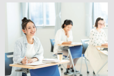
ナジック管理物件の入居者さまが学ぶことのできないオリジナルキャリアプログラムを提供するナジックキャリアアカデミー(NCA)