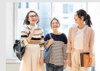
イベントを通じて入居者同士の交流を図るナジックラボ(N-lab)

現代社会における学生たちは、SNSの普及により、いつでもどこでも人とつながれる社会になった一方で、友人の減少や社会的孤立といった「人間関係の希薄化」を実感する機会が増えてきています。就職活動においては、早期から情報収集や企業研究・インターン参加をする学生も多く、「就活」そのものに不安を感じている学生も少なくありません。その不安緩和のため、新たなサービスとして「ナジックラボ(N-lab)」と「ナジックキャリアアカデミー(NCA)」を展開し、キャンパスライフをトータルサポートします。