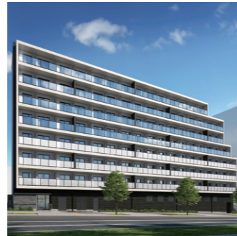
リビオセゾン高円寺

日鉄興和不動産株式会社様の「LIVIO SAISON」シリーズ第4号物件。学生・社会人問わず人気の高い街「高円寺」に完成した188戸の大型学生レジデンスです。1階のカフェテリアでは朝・夕の食事ももちろん、併設されたシェアキッチンでのコミュニケーションの醸成が期待できます。同時期竣工の第3号物件「リビオセゾン早稲田」も、早稲田大学の学生を中心に大変好評です。